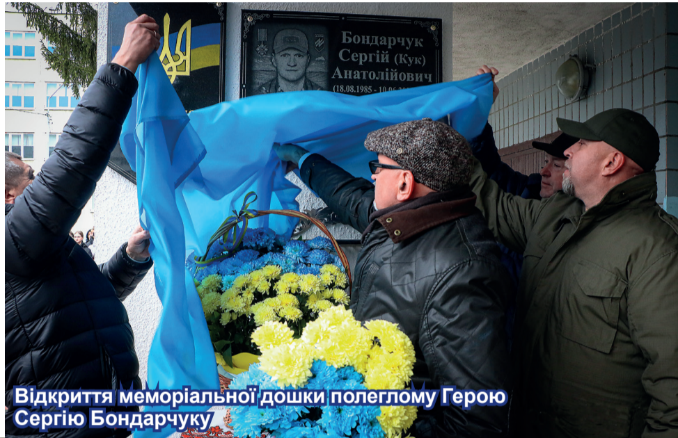
Відкриття меморіальної дошки полеглому Герою Сергію Бондарчуку