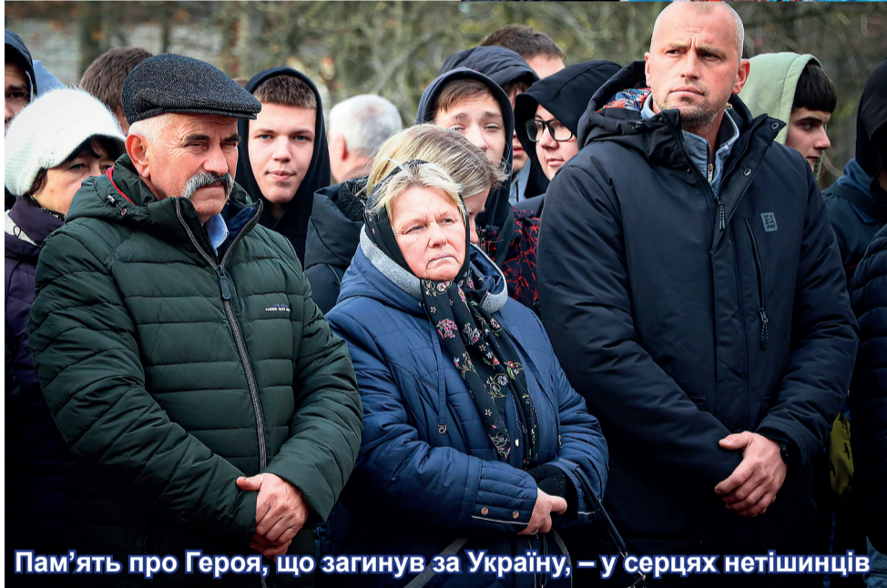
Пам'ять про Героя, що загинув за Україну, – у серцях нетішинців

ків, працівників Хмельницької АЕС, які зібрали кошти на придбання матеріалу.