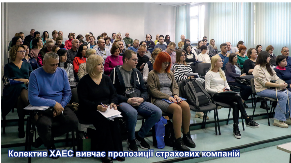
Колектив ХАЕС вивчає пропозиції страхових компаній

З року в рік зацікавленість працівників енергопідприємства у добровільному медичному страхуванні зростає, тому зустріч викликала жваве обговорення. Кожен працівник має можливість ознайомитись із запропонованими програмами ДМС у «Загальних папках» Outlook та, беручи до уваги індивідуальні особливості та потреби, зробити зважений вибір.