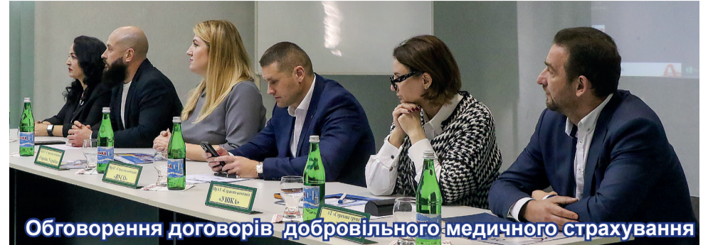
Обговорення договорів добровільного медичного страхування

pop-life страховик з більш ніж 80 представництвами по всій країні. Автострахування, медичне страхування, страхування майна та вантажів для приватних і корпоративних клієнтів – основні напрямки роботи. В компанії працює понад 250 співробітників. Ключові країни присутності: Болгарія, Північна Македонія, Україна, Грузія, Греція, Іспанія, Італія, Польща, Нідерланди, Німеччина, Велика Британія. Добровільним медичним страхуванням від Євроінс користуються більше ніж 25 000 застрахованих. Серед них – підпри-