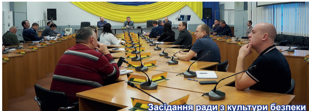
Засідання ради з культури безпеки

пеки її учасники проводили оцінку показників експлуатаційної безпеки, виконання програми конкретних дій, спрямованих на розвиток культури безпеки, результатів спостережень за роботою персоналу, їхньої ефективності. Обговорено також низку важливих заходів щодо вдоскона-