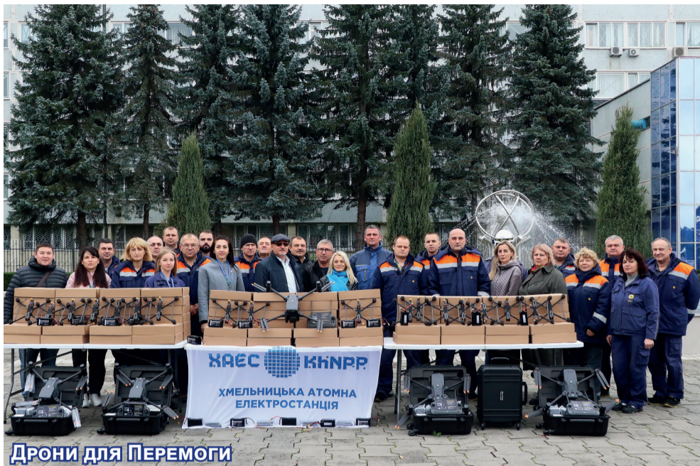
Дрони для Перемоги

Працівники ХАЕС продовжують нарощувати оберт допомоги заради Перемоги. Днями на фронт спрямували автомобілі, чергову партію квадрокоптерів та безпілотний літальний апарат Vampire.