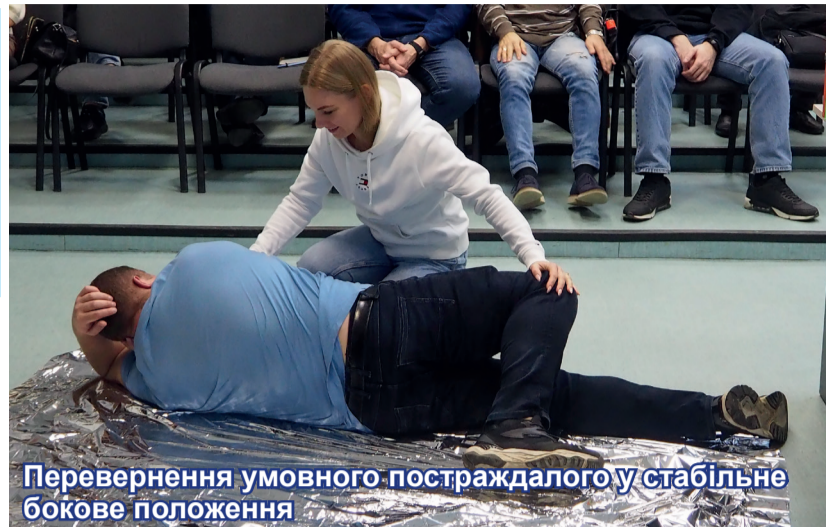
Перевернення умовного постраждалого у стабільне бокове положення