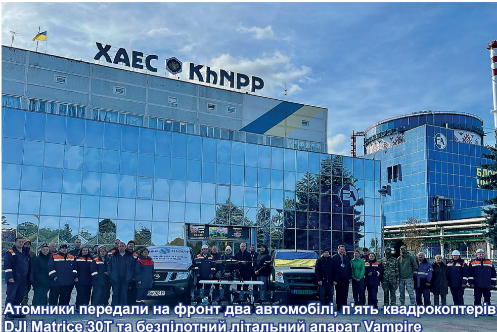
Атомники передали на фронт два автомобілі, п'ять квадрокоптерів DJI Matrice 30T та безпілотний літальний апарат Vampire

Відремонтвані, укомплектовані гумою автомобілі вирушили до військових підрозділів Запорізького та Донецького напрямків, у яких проходять службу пра-