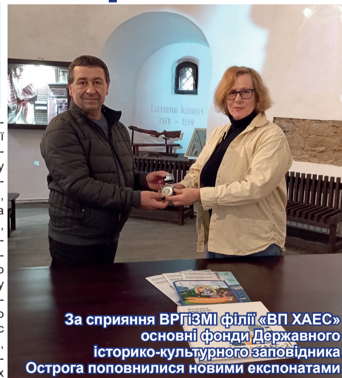
За сприяння ВРГіЗМІ філії «ВП ХАЕС» основні фонди Державного історико-культурного заповідника Острога поповнилися новими експонатами

Першу таку срібну монету Королівський монетний двір Канади випустив у 2016 році. Вона була приурочена до 125-річчя утворення першого українського поселення в Канаді. У лютому 2021 року монетний двір