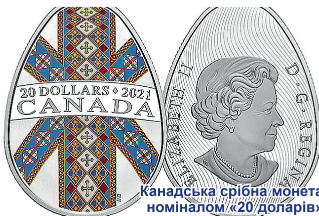
Канадська срібна монета номіналом «20 доларів»