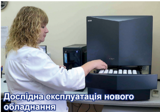
Дослідна експлуатація нового обладнання

Вимірювання цього елемента проводяться рідинно-сцинтиляційним методом, який дозволяє фіксувати світлові спалахи, що виникають при його розпаді. Кожен спалах – результат дії