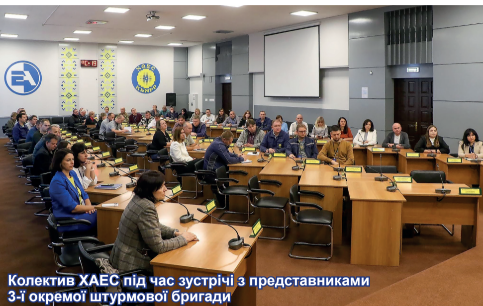
Колектив ХАЕС під час зустрічі з представниками 3-ї окремої штурмової бригади

Власна інформація