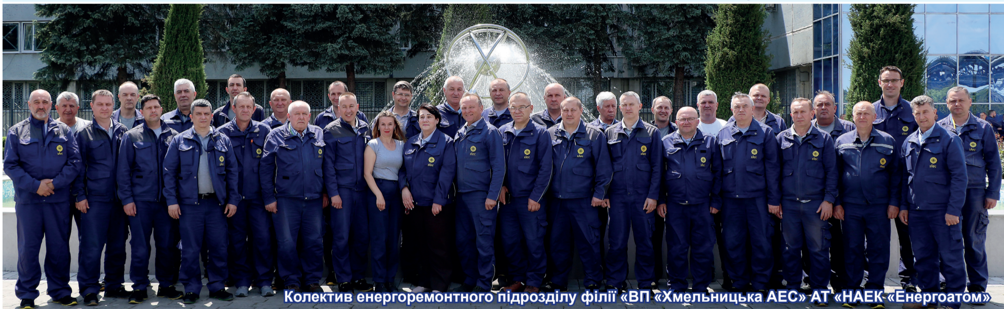
Колектив енергоремонтного підрозділу філії «ВП «Хмельницька АЕС» АТ «НАЕК-«Енергоатом»

Виповнилося сорок років від дня заснування на Хмельницькій АЕС енергоремонтного підрозділу.