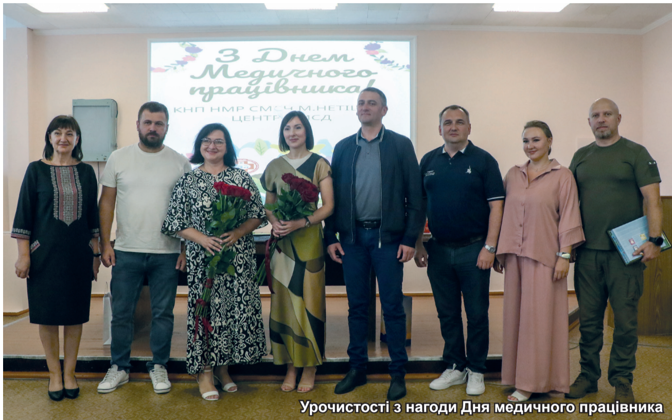
Урочистості з нагоди Дня медичного працівника