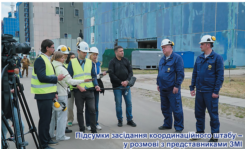
Підсумки засідання координаційного штабу – у розмові з представниками ЗМІ

Про це повідомив керівник АТ «НАЕК «Енергоатом» Петро Котін під час спілкування з журналістами у межах робочого відрядження на Хмельницьку атомну електростанцію. Нові потужності – це гарантія того, що майбутні покоління українців не залишаться без електроенергії.