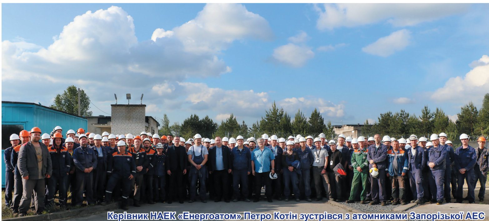
Керівник НАЕК «Енергоатом» Петро Котін зустрівся з атомниками Запорізької АЕС

Керівник НАЕК «Енергоатом» Петро Котін зустрівся з атомниками Запорізької АЕС, які залучені до будівництва нових потужностей на Хмельницькій АЕС. Зустріч відбулася у режимі діалогу. Атомники мали змогу почути відповіді на актуальні запитання.