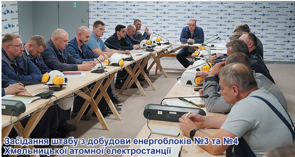
Засідання штабу з добудови енергоблоків №3 та №4 Хмельницької атомної електростанції