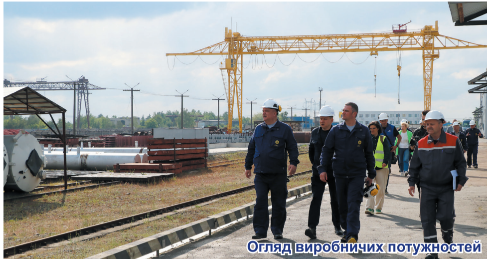
Огляд виробничих потужностей