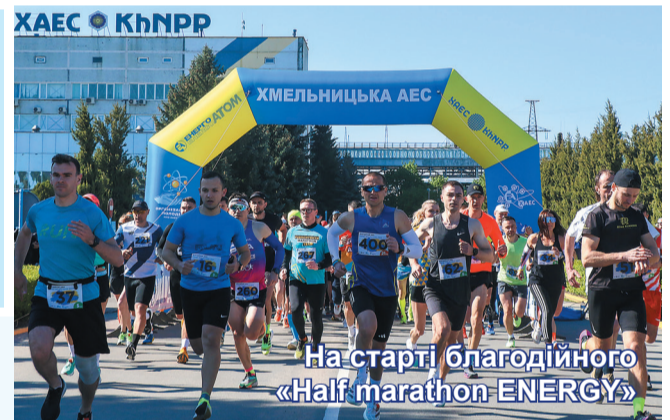
На старті благодійного «Half marathon ENERGY»

«Головна мета участі у благодійному заході – це на-самперед допомога ЗСУ, далі – результат, підтримання