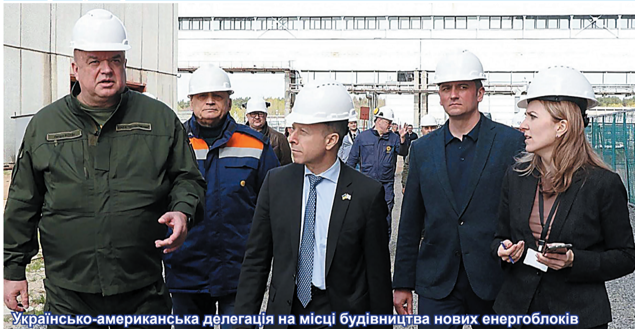
Українсько-американська делегація на місці будівництва нових енергоблоків

У ході робочого візиту на Хмельницьку атомну електростанцію очільник АТ «НАЕК «Енергоатом» Петро Котін та президент і головний виконавчий директор Westinghouse Electric Company Патрік Фрагман оглянули хід відновлювальних робіт на третьому та четвертому енергоблоках ХАЕС.