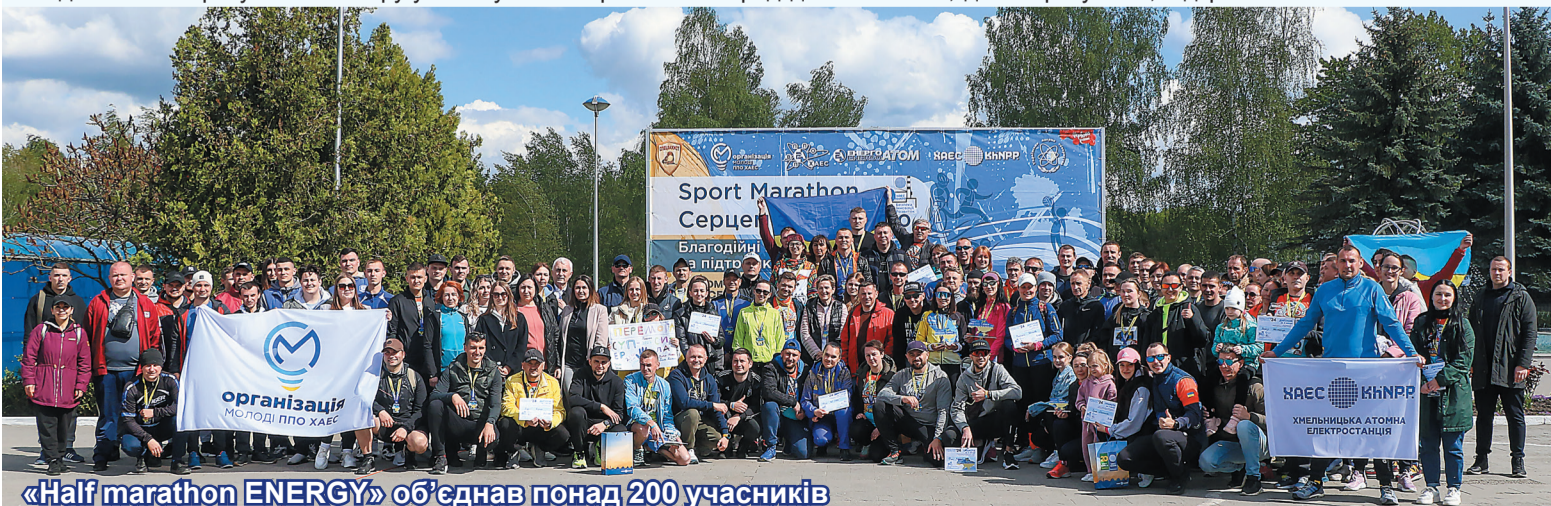
«Half marathon ENERGY» об'єднав понад 200 учасників