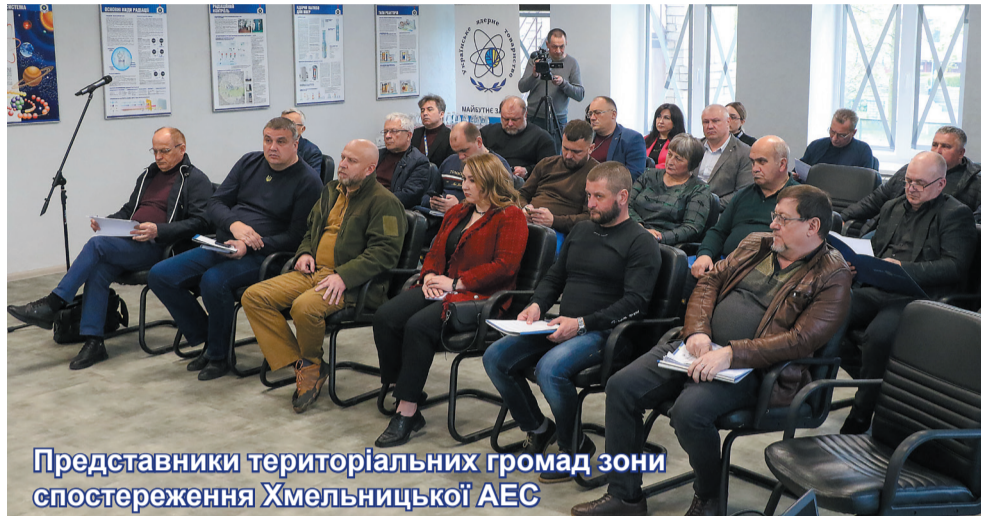
Представники територіальних громад зони спостереження Хмельницької АЕС