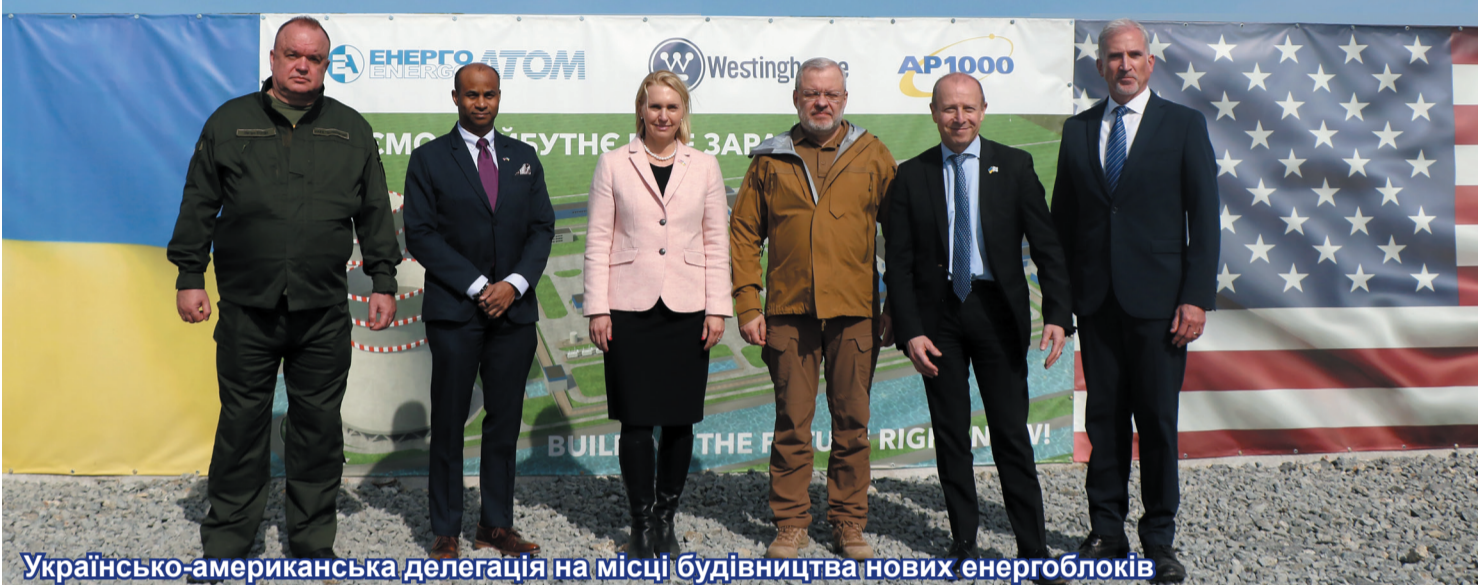
Українсько-американська делегація на місці будівництва нових енергоблоків

11 квітня Енергоатом розпочав проєкт зі зведення енергоблоків ХАЕС-5 та ХАЕС-6 за технологією AP1000 Westinghouse на Хмельницькій АЕС.