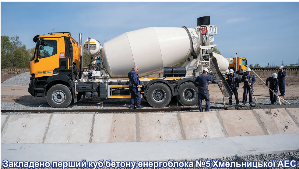
Закладено перший куб бетону енергоблока №5 Хмельницької АЕС

Радіаційний, екологічний та протипожежний стан на промисловому майданчику та у прилеглих регіонах знаходиться на рівні, відповідному нормальній експлуатації енергоблоків, і не перевищує природних фонових значень.