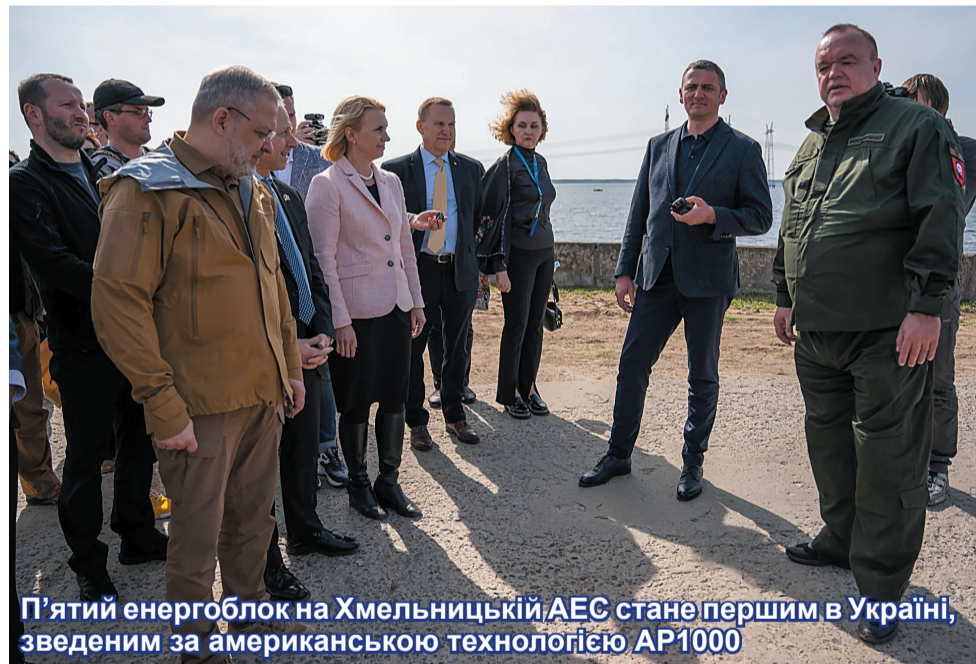
П'ятий енергоблок на Хмельницькій АЕС стане першим в Україні, зведеним за американською технологією AP1000

Посол США в Україні Бріджит Брінк наголосила, що на тлі постійних обстрілів критичної інфраструктури Україна потребує більше енергетичних потужностей, і основний фокус зосереджений на атомній