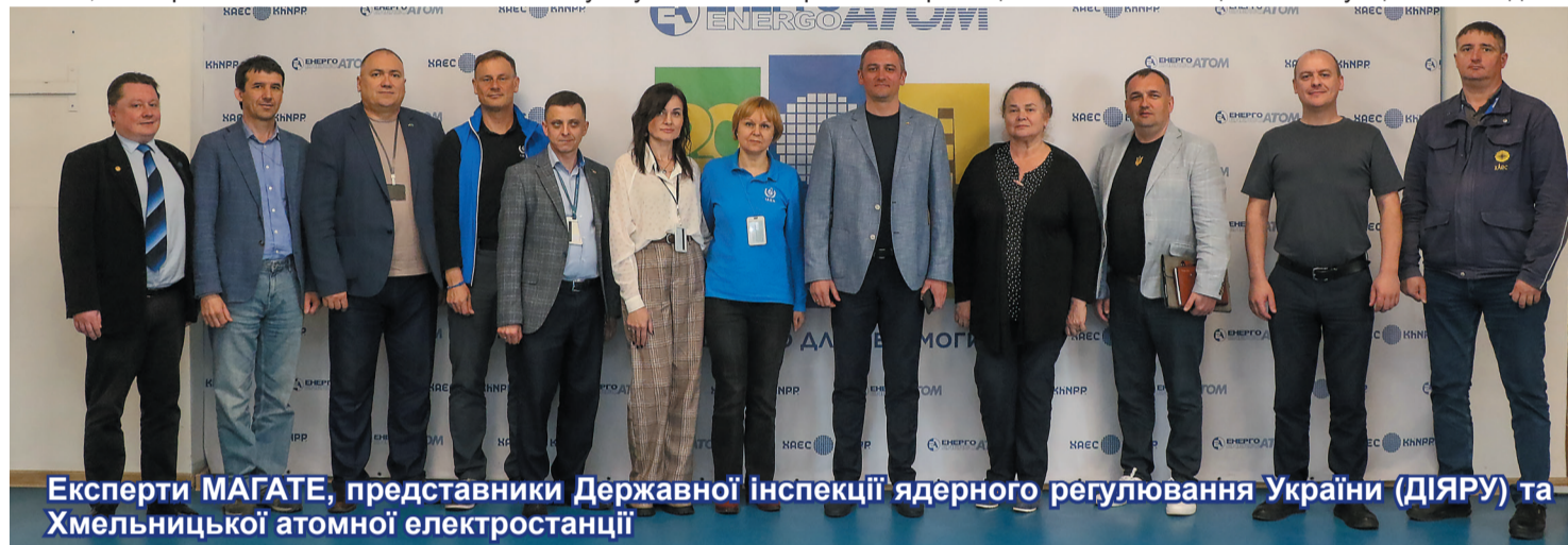
Експерти МАГАТЕ, представники Державної інспекції ядерного регулювання України (ДІЯРУ) та Хмельницької атомної електростанції