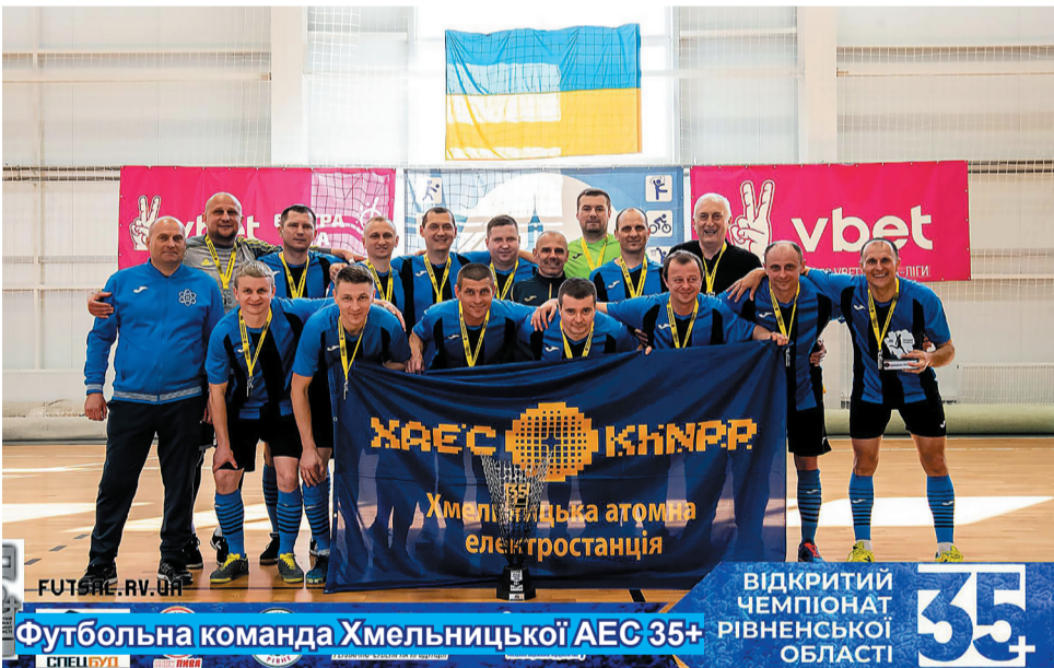
Футбольна команда Хмельницької АЕС 35+