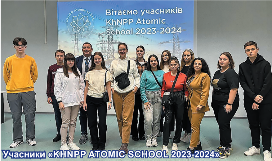
Учасники «KHNPР АТОМІС SCHOOL 2023-2024»

Мета проєкту – популяризація атомної енергетики, налагодження партнерських стосунків підприємства із навчальними закладами Нетішина та 30-кілометрової зони спостереження ХАЕС, підтримка позитивного іміджу електростанції з метою формування якісного кадрового резерву персоналу для ХАЕС з числа здобувачів освіти.