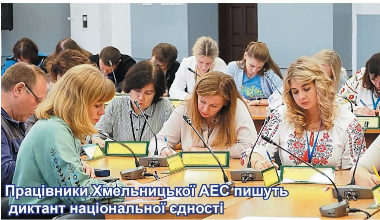
Працівники Хмельницької АЕС пишуть диктант національної єдності