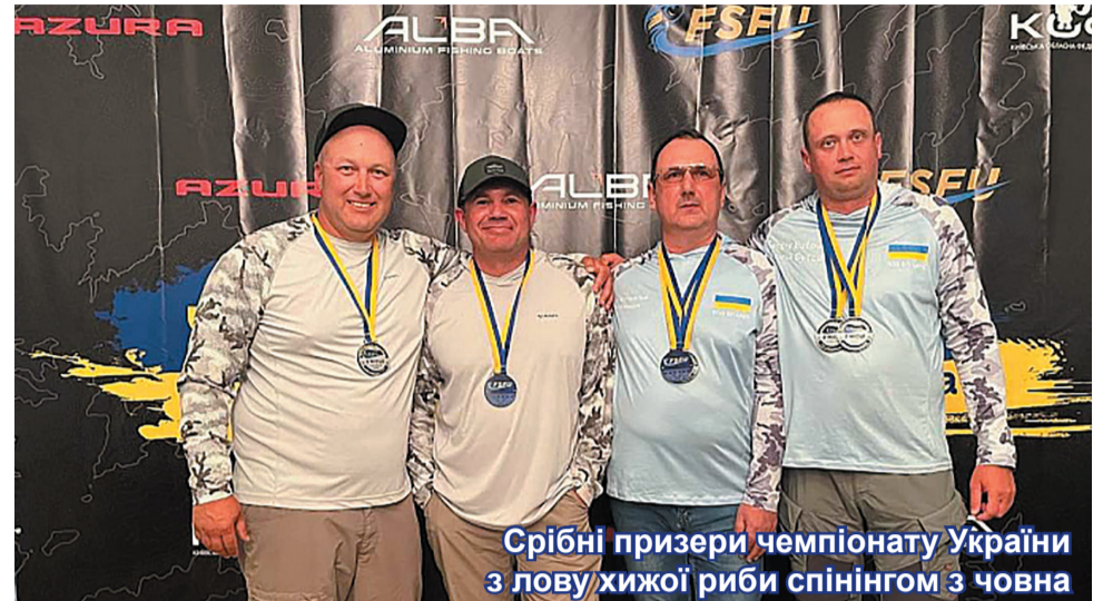
Срібні призери чемпіонату України з лову хижої риби спінінгом з човна

Цього дня учасники та глядачі збрали кошти на допомогу ЗСУ у сумі 43500 гривень, які вирішили перевести на рахунок ГО «Енергія наших сердець», де волонтерять працівники Хмельницької АЕС.