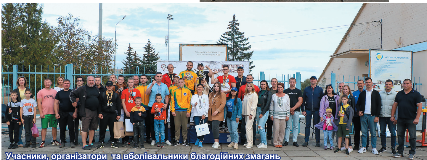
Учасники, організатори та вболівальники благодійних змагань