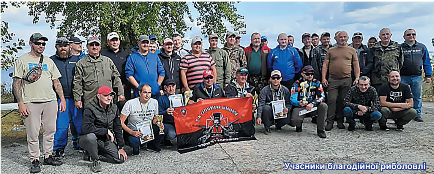
Учасники благодійної риболовлі