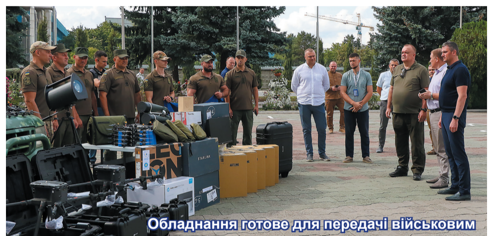
Обладнання готове для передачі військовим

У ході візиту на Хмельницьку АЕС президент НАЕК «Енергоатом» Петро Котін провів виробничу нараду з керівництвом та колективом електростанції, темою якої було позапланове завершення ремонту першого енергоблока. Присутні обговорили основні результати роботи, перебіг ремонтної кампанії, а також питання посилення безпеки на ядерному об'єкті. Цьогорічна ремонтна кампанія, за сло-