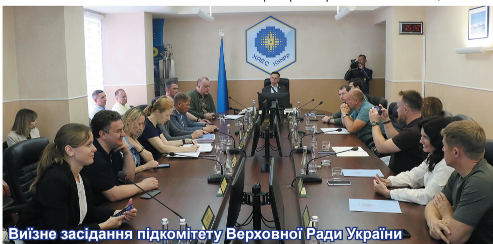
Візне засідання підкомітету Верховної Ради України

Своєю чергою парламентарі заповіли, що сприятимуть зміцненню та розбудові ві-