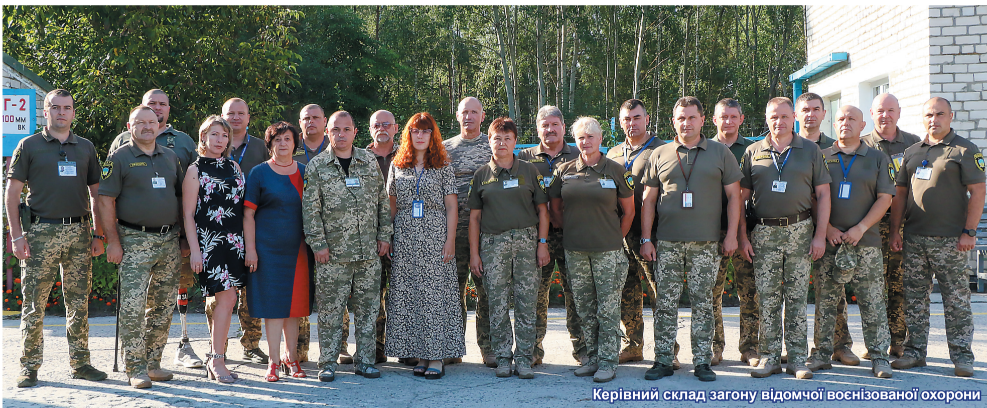
Керівний склад загону відомчої воєнізованої охорони

моги до працівників. При відборі на службу кандидати повинні здати нормативи з фізичної підготовки, пройти психофізіологічне обстеження на базі навчально-тренувального центру. Якщо раніше при працевлаштуванні перевагу надавали чоловікам, які служили у Збройних силах України, нині пріоритети змінилися, чоловіки пішли на фронт. Відтак впродовж нинішнього року на роботу брали переважно жінок. Наразі у загоні забезпечено гендерну рівність.