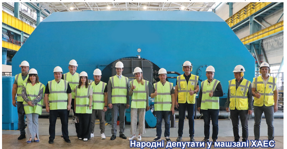
Народні депутати у машзалі ХАЕС

2 вересня 2023 року президент ДП «НАЕК «Енергоатом» Петро Котін знову відвідав наймолодшу українську АЕС.