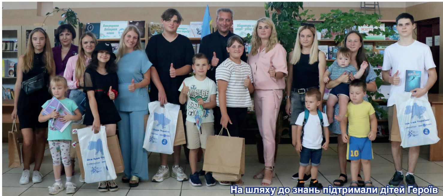
На шляху до знань підтримали дітей Героїв

в окопах, підписав новодруки, звернувшись до кожної дитини на ім'я. Ці книжечки, переконана пані Руслана, стануть для дітей справжнім оберегом та підтримкою від ви-