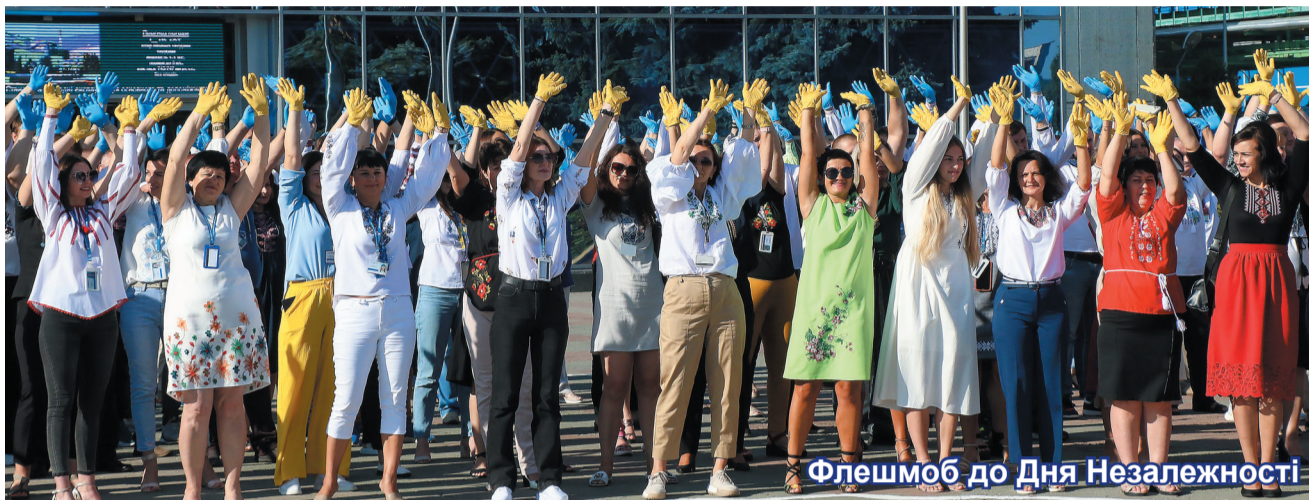
Флешмоб до Дня Незалежності

Волонтерство – одна з найголовніших сьогоднішніх чеснот колективу атомників. Уже стало традицією під час численних благодійних акцій збирати кошти на підтримку ЗСУ. 24 серпня, у День народження країни, працівники енергопідприємства спільно задонатили 19 тисяч 620 гривень. Кошти будуть спрямовані на підтримку наших захисників.