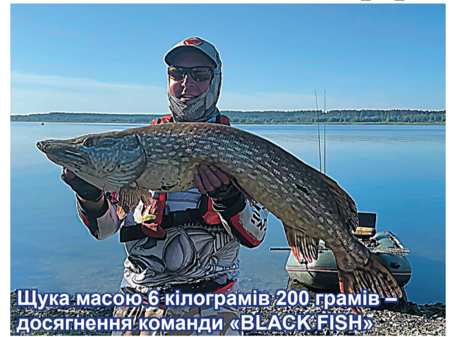
Щука масою 6 кілограмів 200 грамів – досягнення команди «BLACK FISH»

Судді також взяли участь у приготуванні різних традиційних рибальських страв, серед яких незмінною королевою куховарства є рибальська юшка. Знову її приготування було довірено неперевершеному ку-