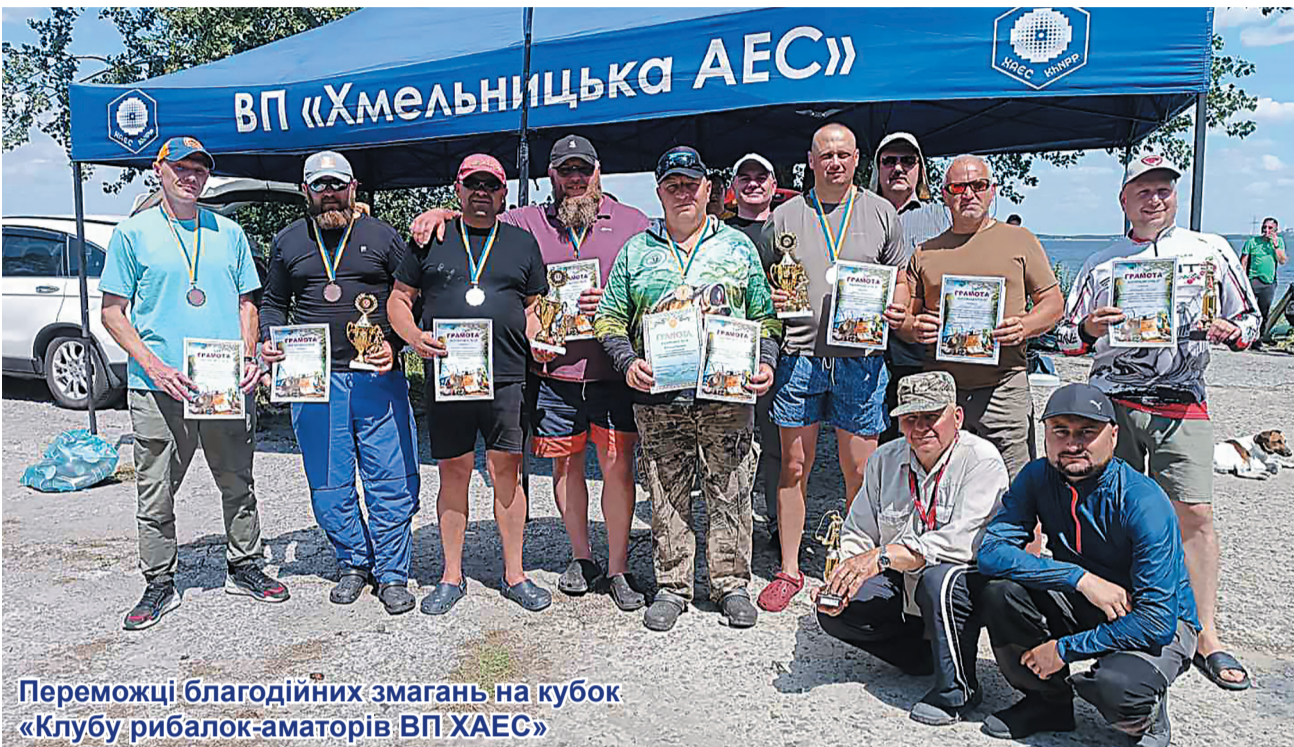
Переможці благодійних змагань на кубок «Клубу рибалок-аматорів ВП ХАЕС»

Минулої неділі на технологічній водоймі Хмельницької АЕС відбулися благодійні змагання на кубок «Клубу рибалок-аматорів ВП ХАЕС» з лову хижої риби з човна. Захід, приурочений до Дня рибалки, проводився на підтримку Збройних сил України. Зареєструвалися вісім десятків учасників.