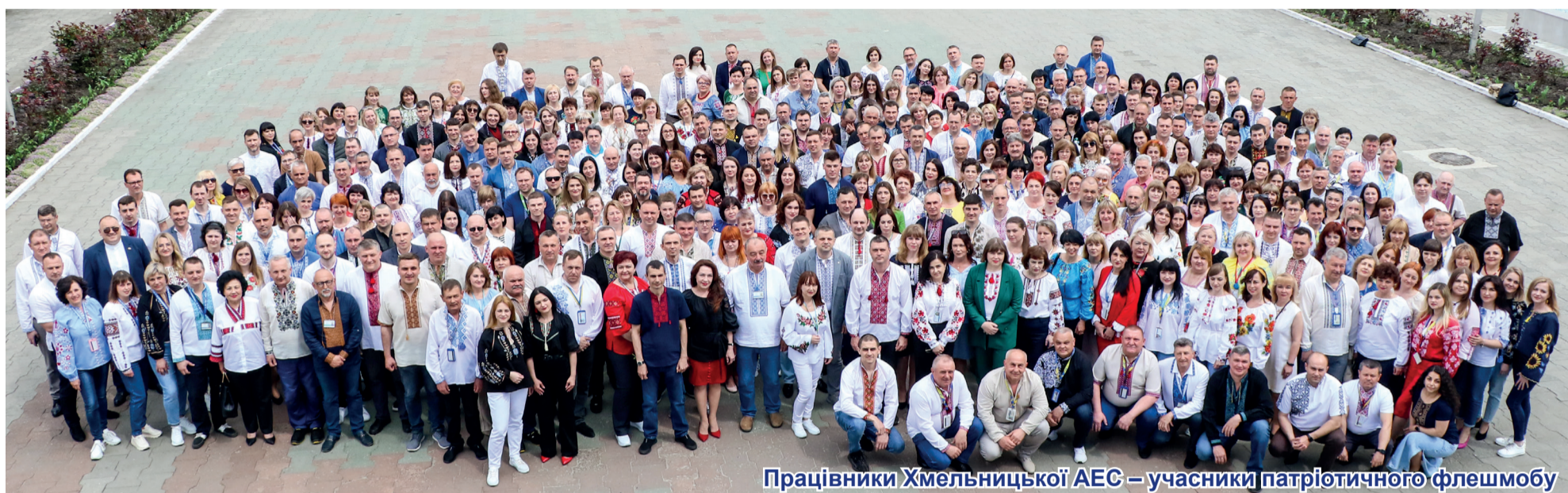
Працівники Хмельницької АЕС – учасники патріотичного флешмобу