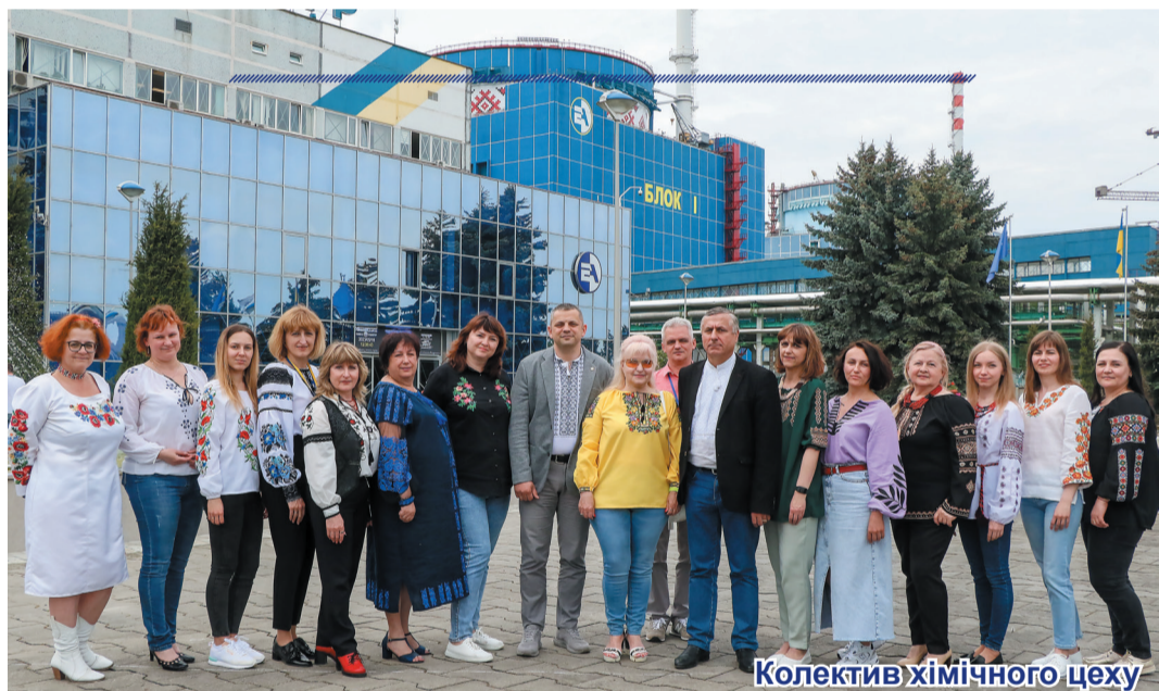
Колектив хімічного цеху

Колектив Хмельницької АЕС не лише у свято демонструє свою патріотичну позицію. Щодня, тримаючи енергетичний фронт та невтомно підтримуючи армію, енергетики наближають Перемогу!