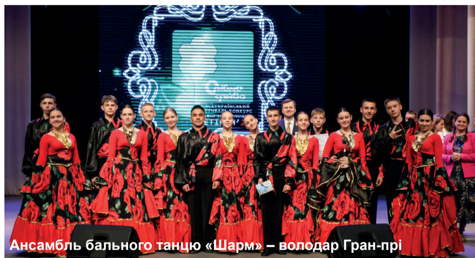
Ансамбль бального танцю «Шарм» – володар Гран-прі

мистецтв. «У темні часи ви несете світло», – звернувся артист-віртуоз до творчої молоді. Він переконаний, що з часом конкурсанти «Срібного сяйва» поповнять ряди мистецької еліти України.