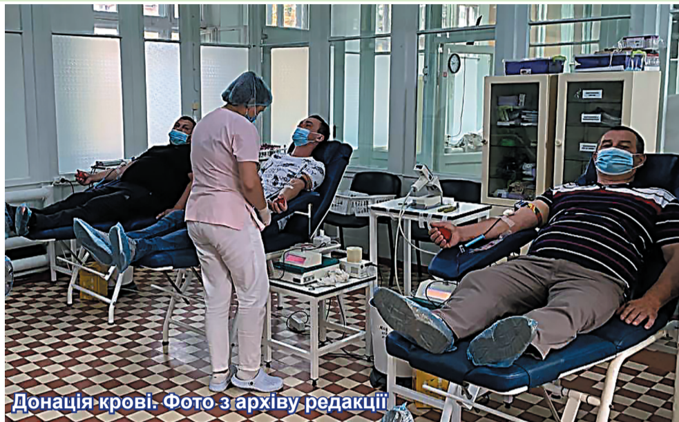
Донорство крові.