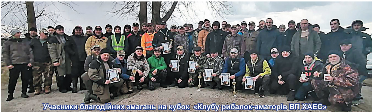
Учасники благодійних змагань на кубок «Клубу рибалок-аматорів ВП ХАЕС»