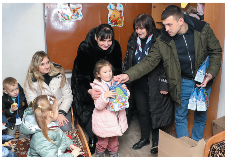
Власна інформація

Не лишаймося осторонь, зробимо світ навколо нас кращим!