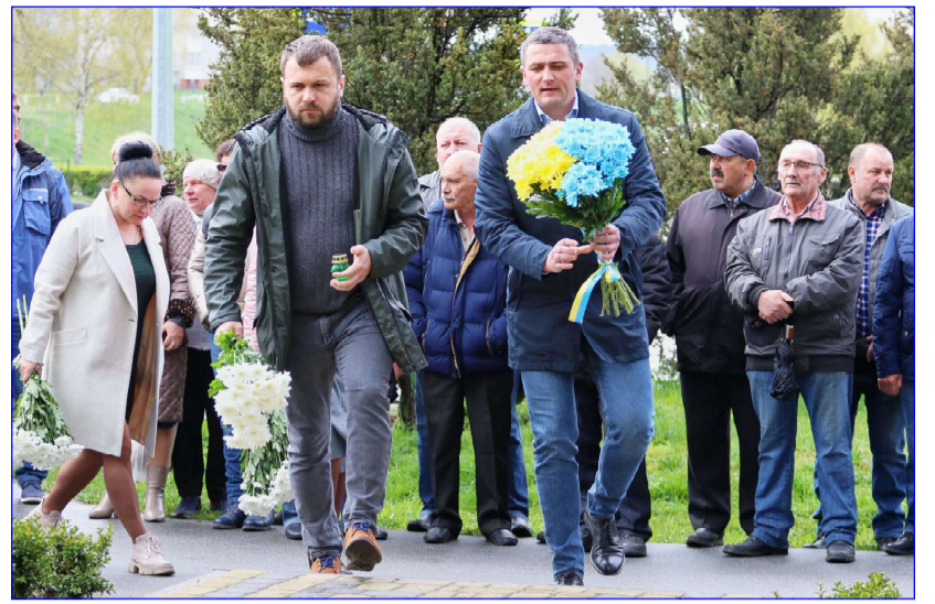
Фото Євгена Цибульського