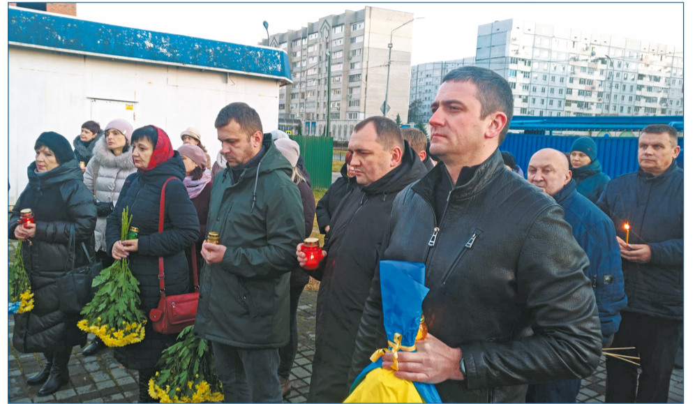
Рада України ухвалила Закон «Про Голодомор 1932-1933 років в Україні», який трактує події 1932-1933 років, як геноцид українського народу.