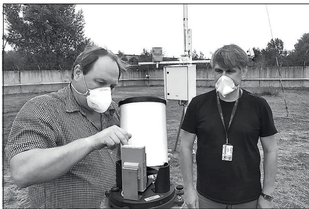
випромінювання. Інформація передається на станцію збору даних центрального

АСКРО впроваджена на Хмельницькій АЕС у рамках пуску другого енергоблока паралельно із існуючою системою радіаційного контролю енергоблоків. До складу АСКРО входять 15 постів-контейнерів радіаційного контролю, чотири з яких розміщені на проммайданчику, а решта - у 30-кілометровій зоні. Також на проммайданчику знаходяться 7 постів контролю потужності дози гамма-