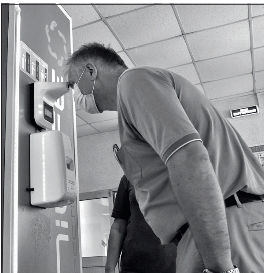
Режим роботи тунелів визначається на засіданнях штабу з проведення карантинних заходів на ХАЕС відповідно до епідеміологічної ситуації на підприємстві та у місті-супутнику.

На Хмельницькій АЕС змонтовано п'ять тунелів, чотири з яких розташовані на центральній прохідній. Перший тунель при вході до навчально-тренувального центру Хмельницької АЕС запрацював у режимі дослідної експлуатації попереднього тижня.