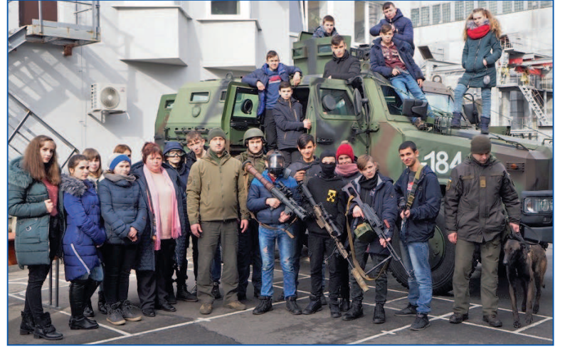
Таке поєднання інформаційно-просвітницького та патріотичного в екскурсії на найпотужніший в регіоні енергетичний об'єкт надзвичайно сподобалося юним екскурсантам.

Відповідаючи на питання школярів: «Як у майбутньому стати офіцером?» – командир військової частини полковник Костянтин Кабанов націлив учнів добре навчатись, всебічно розвиватись та у подальшому вступати до навчальних закладів Національної гвардії України.