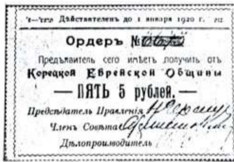
Бон містечка Корці варт. 5-ти рублів (розмір 9,7×6,5 см).

Друкувалися на блакитному папері, мали герб міста і всі інші необхідні в цьому випадку атрибути. Багато бонів видав продовольчий відділ рівненської міської управи. Перші з них ціною 5 і 10 рублів, що з'явилися в березні, були російськомовні. А травневі 10 і