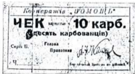
Чек кооперативи "Помощ" у Дубно (розмір 12×7,2 см).

Нарешті, чим виокремлювались кременецькі гроші з-посеред інших, собі подібних на Волині, то це тим, що вже у 1920 році, за польської влади, вони друкувалися польською мовою. Ось фраза автора: "Це, мабуть, одинокі місто на Волині, що мало гроші