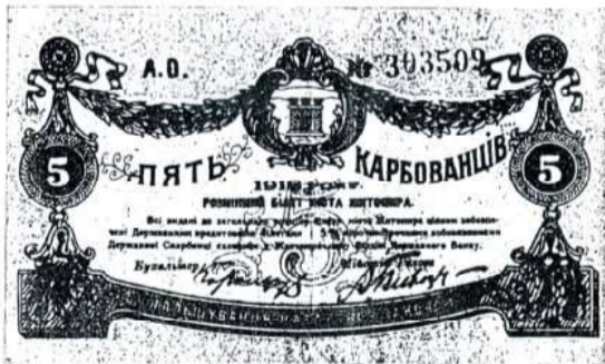
Розмінний білет м. Житомира варт. 5-ти карбованців (розмір 15×9,8 см).

в польській мові". Їх вартість – 1, 3 і 5 польських марок. На лицевій стороні вгорі був герб Кременця, польський орел і напис: "5 marek polskich 5. Kto podrabia lub faizuje te bonu, podlega odpowiedzialnoñci sñadowej". Внизу три підписи. На звороті наступний напис: "Magistrat m. Krzemieccsa przyjmuje odpowiedzialnoñz za wymiank niniejszego bonu na marki polskie. Ten