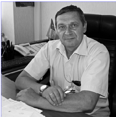
Рівненській АЕС. Він, до речі, до 2018 року працював на ХАЕС в

складі енергоблока №2 і переданої на модернізацію за технологією ALSTOM.