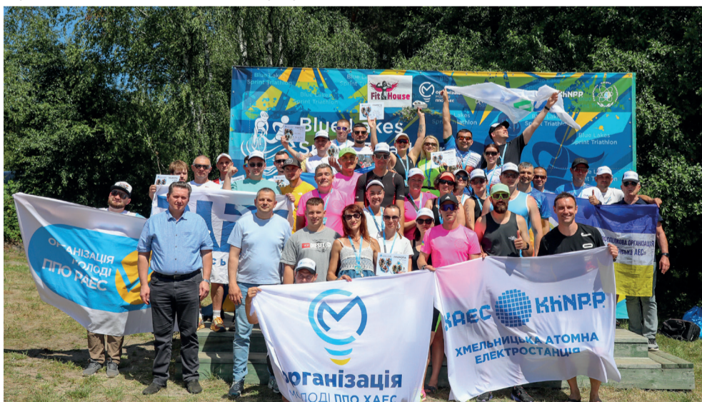
Кращі спортсмени заходу