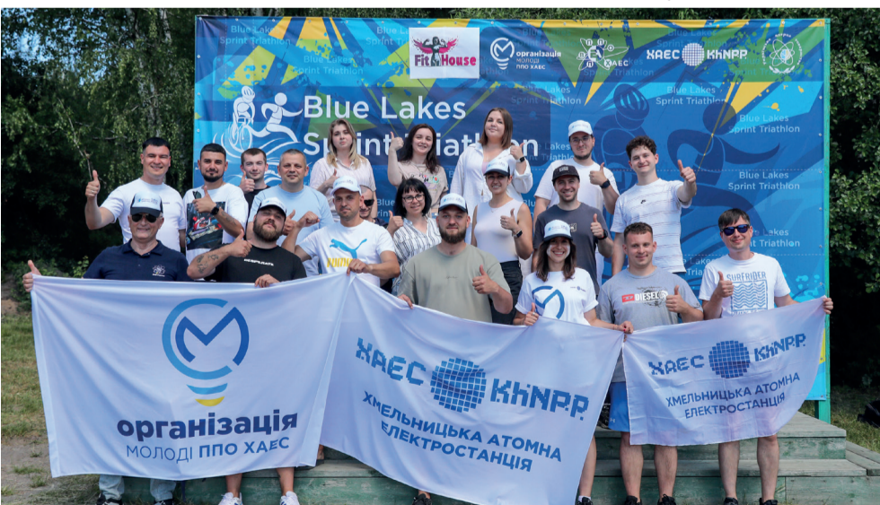
Організатори благодійного спринт-тріатлону «Голубі озера 2026»