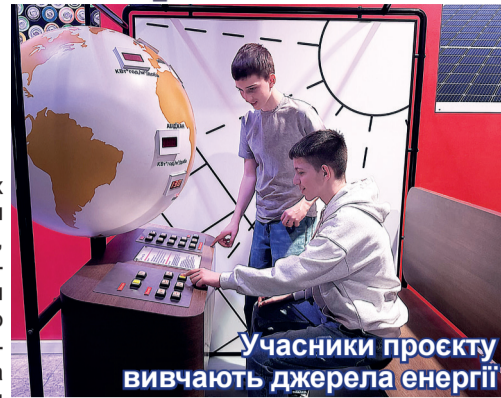
Учасники проєкту вивчають джерела енергії

Реалізація проєкту «Реактор знань» спрямована на розвиток інтелектуального